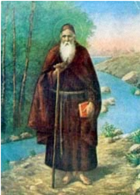
Fotos 11 y 12: San Conrado Confalonieri ("El Santo curador de las hernias")

Poniendo fin a estas palabras, no puedo dejar de manifestar mis agradecimientos a la "Sociedad Hispanoamericana de Hernia", a la "Universidad Autónoma de Chile", a las diversas instituciones y empresas que han colaborado en una u otra forma para que este Evento sea una realidad; a los cirujanos de Santiago, Valdivia, Argentina, México y España, que se han desplazado desde sus respectivos lugares y países, para mostrarnos no solo su experiencia sino también los avances y novedades en el campo del tratamiento quirúrgico de las hernias; a los Colegas que de diversos puntos del país, asisten a este Curso y que constituyen el leitmotiv de este evento.